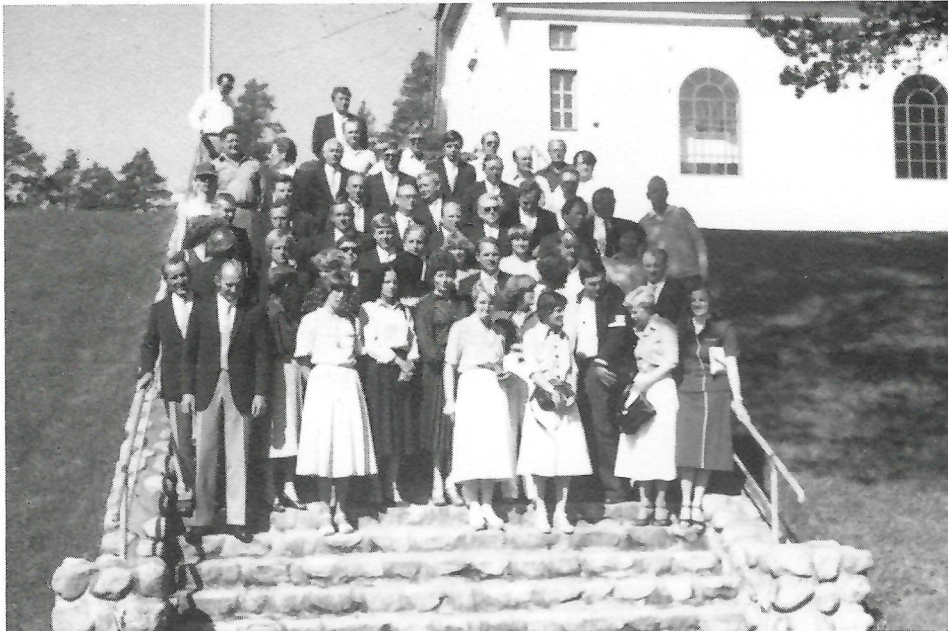
Der Kaunitzer Männer-Chor nebst Angehörigen nach dem gemeinsamen Kirchenbesuch in Jämsänkoski. Es wurden Lieder aus der Schubert-Messe gesungen.

Am 5. Juni 1980 startete unser Chor zum Gegenbesuch nach Finnland. 54 Damen und Herren machten sich auf die große Reise. Am Abend des 5. 6. bestiegen wir die bequeme »Finnjet« mit Kurs auf Helsinki. 24 Stunden schaukelten wir auf der Ostsee. Von Helsinki ging es mit dem Bus 250 km über Autobahnen und Straßen zu unserem Zielort Jämsänkosken Laulumiehet in Mittelfinnland. Am späten Freitagabend wurde uns ein herzlich-warmer Empfang bereitet. Die Wiedersehensfreude war groß. Neben den musikalischen Auftritten ist die Geselligkeit nicht zu kurz gekommen. Allen Teilnehmern wird die Finnlandreise unvergessen bleiben. Denn die Bande bestehen heute noch.