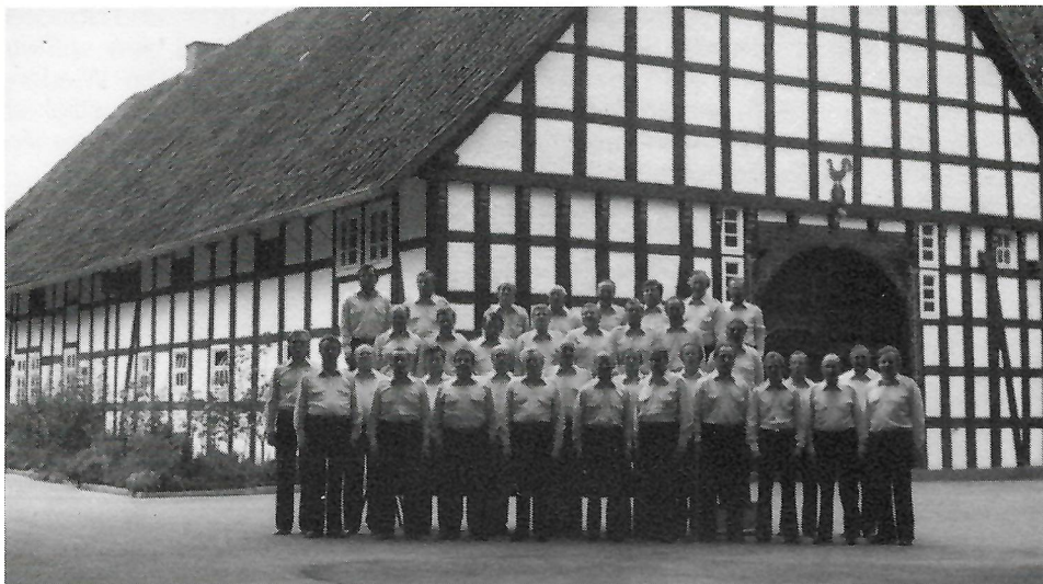
Der Männer-Chor Kaunitz im Jahre 1978 auf dem Hof Johannliemke. In diesem Jahre fand das erste Treffen mit unserem finnischen Partnerchor statt.

singt« war ein voller Erfolg. Unseren Gästen haben wir in der wenigen Freizeit die nähere Umgebung gezeigt; auch das gemütliche Feiern mit ihnen kam nicht zu kurz.