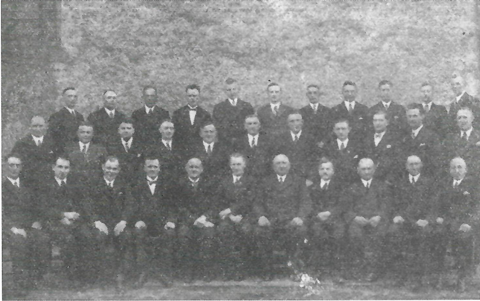
Die aktiven Sänger des MGV Kaunitz im Jubeljahre 1935.

freudig begrüßt, die Festansprache. Nach dem Jubiläum nahm der Verein noch an der Feier des 10jährigen Jubiläums des Männergesangsvereins »Liedertafel« Verl und an einem Wertungssingen des Kreises teil.