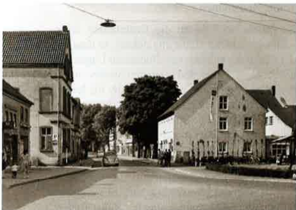
Die Hauptstraße 1959. Von rechts mündet hier die Paderborner Straße ein. Hinter dem VW-Käfer ist eine BMW-Isetta zu erkennen; hier begann in der heutigen Wilhelmstraße die Landstraße nach Gütersloh. Der direkte Durchbruch zur Paderborner Straße kam nach dem Abbruch des Friseurgeschäfts Pollmeier (ganz links im Bild).

„Zudem hat die Chaussee, da sie nicht dem Projecte gemäß, nämlich von Bielefeld bis Paderborn zur Ausführung gekommen, wenig Werth für Verl, indem sie in Kaunitz endet und von dort nach Paderborn resp. bis Neuhaus schlechte Communal Wege führen. Nur in der sicheren Voraussetzung, daß die Chaussee über Hövelhof nach Paderborn hin gleichzeitig mit dem Ausbau der Chaussee von Brackwede nach hier zur Ausführung gelangen werde, hat das Amt Verl gebaut.“