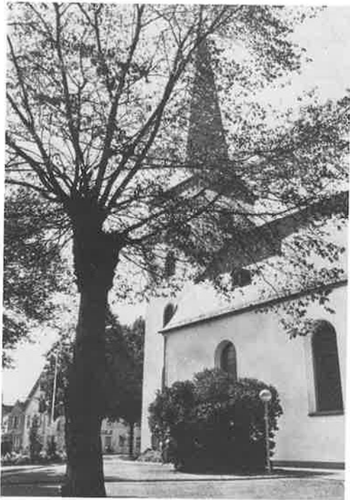
Die Pfarrkirche Kaunitz – vom Grafen Maximilian Ulrich von Kaunitz und seiner Gattin, der Rietberger Erbgräfin Maria Ernestine Franziska, gegründet. Ihr Sohn, Graf Wenzel Anton von Rietberg-Kaunitz, legte 1746 den Grundstein auf der Mayburg.

Recht bezeichnend ist auch das Hebe-Register, mit dem anlässlich des Besuchs Wenzel Antons aus der Bevölkerung zusätzlich Thaler herausge-